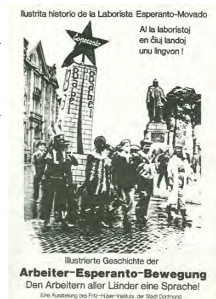
"Historia ilustrada del movimiento obrero esperantista. Una lengua para los trabajadores de todos los países"

Naturalmente, el proceso de transformación no tiene ni principio ni fin o, si lo preferimos, ya ha empezado y sólo acabará cuando todos estemos satisfechos con nuestra sociedad. Sin embargo, a lo largo de la historia se han conocido períodos en los que este proceso se acelera y condensa: los llamamos revoluciones. La revolución libertaria, es decir la supresión del estado, la supresión de todo poder polí-