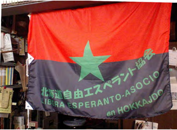
Bandera del grupo "Libera Esperanto-Asocio en Hokkajdo" que en 2008 mantuvo en jaque a la policía japonesa durante la cumbre del G8

tico, de toda dominación, será la revolución más profunda y más extensa de la historia.