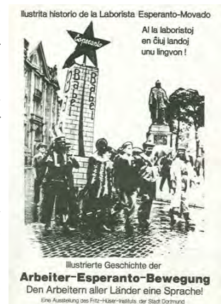
"Historia ilustrada del movimiento obrero esperantista. Una lengua para los trabajadores de todos los países"

Naturalmente, el proceso de transformación no tiene ni principio ni fin o, si lo preferimos, ya ha empezado y sólo acabará cuando todos estemos satisfechos con nuestra sociedad. Sin embargo, a lo largo de la historia se han conocido períodos en los que este proceso se acelera y condensa: los llamamos revoluciones. La revolución libertaria, es decir la supresión del estado, la supresión de todo poder polí-