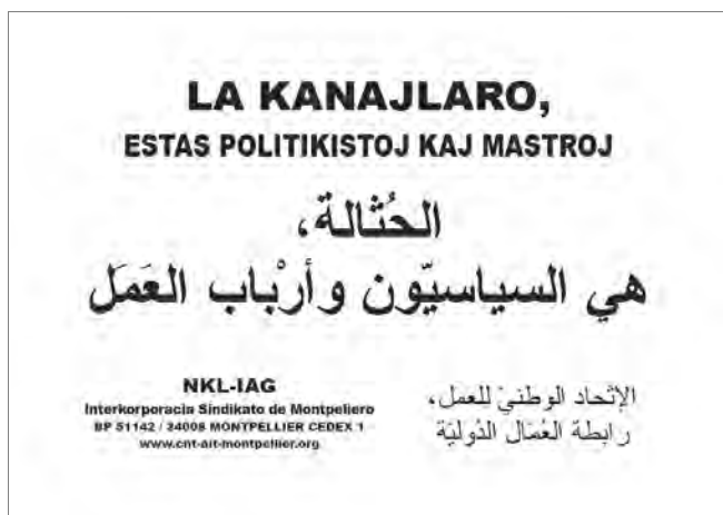
"La chusma son los políticos y los patronos". Cartel de la CNT-AIT francesa

la nueva sociedad basada en la libertad, la justicia y la igualdad. Sabemos perfectamente como afrontar el primer objetivo (aunque no tengamos fuerza suficiente para efectuarlo), tenemos proyectos e ideas bastante claras de como afrontar (y, sobre todo, de como no se debe afrontar) el segundo. Como llevar a término el tercero es materia para profetas y no para militantes. Estudiaremos el papel a desempeñar por el idioma en estos tres períodos por orden inverso.