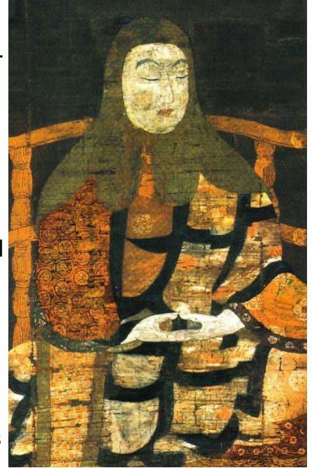
Saicho ( Dengyo Daishi, 767 - 822 )

La escuela Tendai (chin. T'ien-t'ai) surgió como consecuencia del estudio del Saddharmapundarika Sutra. El Sutra del Loto se tradujo por primera vez al chino en el siglo III d.C. y en el siglo VI, el monje Zhiyi fundó un monasterio en el monte Tiantai donde difundió su interpretación global del sutra. Organizó todos los sutras ya existentes de las escuelas Theravada y Mahayana en un esquema dividido en cinco partes, que abarcan los diversos niveles de enseñanza revelados por Buda y que culminan en el sutra del Loto. De este modo, el Tendai es capaz de absorber y generar otros movimientos dentro del budismo.