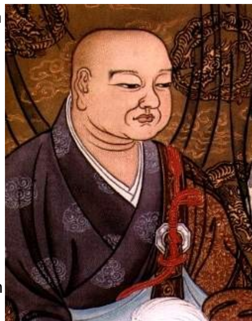
Keizan Jôkin (1264-1325)

Desde muy joven, sobre los ocho años se dedicó a la vida religiosa muy influido por su madre, ferviente seguidora de Kannon. Fue discípulo de Tettsu Gikai (tercer patriarca del linaje de Dôgen). A los diecisiete años realizó un viaje a China para recorrer varios monasterios, donde conoció a Jakuen, un discípulo chino de Dôgen, al cual causó una buenísima impresión. En su peregrinaje por China Keizan también estudió con maestros de la talla de Egyo y Kakushin lo cual fue muy provechoso para su formación ya que ambos pertenecían a la escuela Rinzai y combinaban la práctica del zen con enseñanzas esotéricas procedentes del budismo Shingon y de la rama esotérica del budismo Tendai. Este enfoque de la práctica del Zen influyó mucho en Keizan Jôkin ya que como veremos incorporó algunas de estas prácticas a la tradición Soto Zen.