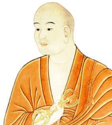
Kukai (Kodo Daishi, 774- 835)

Kukai (774-835), conocido como Kodo Daishi, fue el gran impulsor de esta escuela en Japón. Kukai fue hijo de una familia aristocrática Japonesa, desde muy temprano estudió budismo, Confucionismo y Taoísmo. Con su creatividad brillante dominó ampliamente sus estudios, desarrollando en el año 798, un trabajo conocido como Shiki Sango (Principio de las 3 enseñanzas). Kukai fue a China en el año 804 a estudiar el budismo esotérico en la gran capital de T'ang de Chang-an. Se hizo discípulo de Hui Kuo, quien era uno de los maestros más importantes del budismo en China. Con el tiempo, Kukai desarrolló su propia síntesis de la práctica y de la doctrina esotérica, la cual llevó a su país de origen.