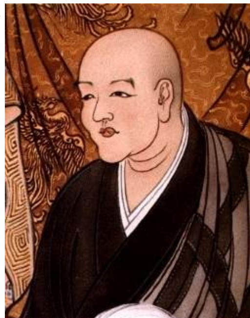
Dôgen Zenji (1200-1253)

Después de aprender en la escuela Tendai, surge en Dôgen el interés por la relación que existe entre la naturaleza búdica y la iluminación. Dôgen se preguntaba, si "tanto las enseñanzas exotéricas como esotéricas explican que una persona, en esencia tiene la verdadera naturaleza dharma y es originalmente el cuerpo de la naturaleza búdica, entonces, ¿por qué todos los budas del pasado, presente y futuro buscan la iluminación?" 1