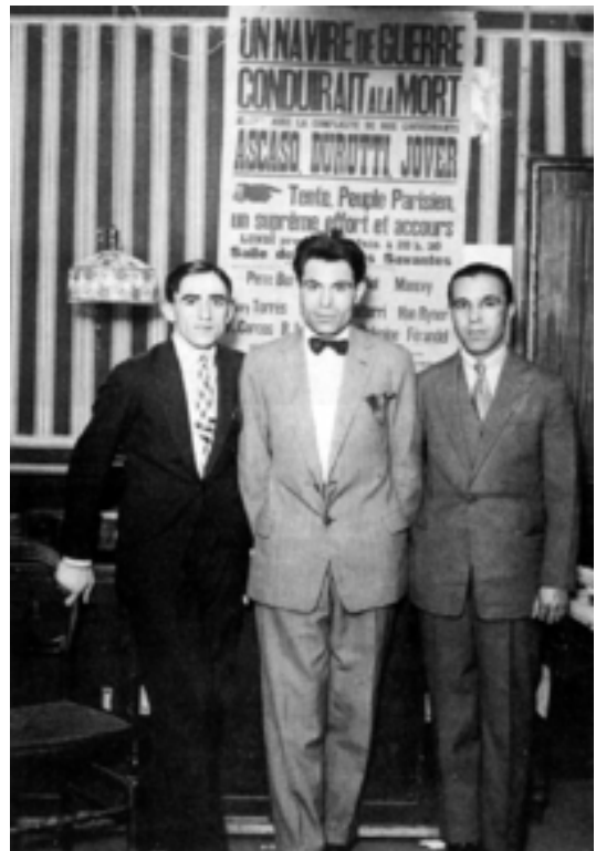
Los Solidarios: Francisco Ascaso, Buenaventura Durutti, Gregorio Jover

Los derechos de propiedad intelectual también cesarían de existir. Debido a que los anarco-comunistas piensan que la renta y otros tributos son explotativas, algunos piensan que estas son presiones arbitrarias que inducen a las personas a funciones no relacionadas. Así pues, se cuestiona el por qué de que alguien tenga que trabajar por "X" horas durante un día para tener que vivir en algún otro lado. En tanto, en vez de trabajar bajo la condición de tener que obtener el salario, ellos creen en trabajar directamente para el objetivo a realizar sin la mediación monetaria u otra de otro tipo en lo