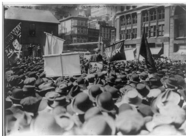
Alexander Berkman hablando en Nueva York

Es aquí cuando la diferencia entre anarquismo y anarcocomunismo se muestra más claramente: el anarcocomunismo ha tomado esos difíciles aspectos de la vida, ha buscado comprenderlos y ha integrado estrategias libertarias que implicaban dichos aspectos.