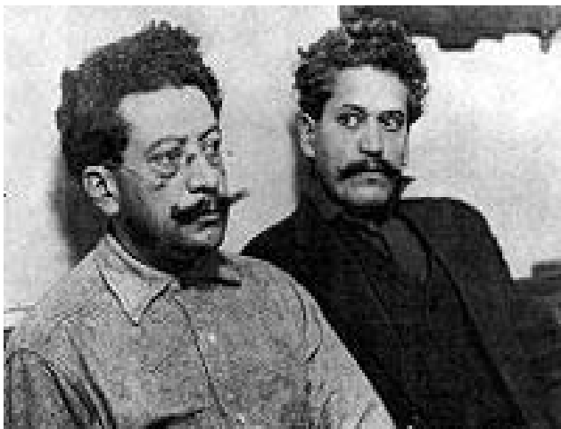
Los hermanos Ricardo y Enrique Flores Magón presos en Los Ángeles

En México, antes de la Primera Guerra Mundial, el Partido Liberal Mexicano (PLM) de los hermanos Enrique y Ricardo Flores Magón, apoyado por un movimiento de campesinos e indígenas, que deseaban expropiar la tierra, trataron de alcanzar el anarco-comunismo. Miembros del PLM llevaron a cabo actividades de agitación en centros industriales como en Cananea, Sonora y Río Blanco, Veracruz. Y también organizaron varias incursiones armadas desde los Estados Unidos a distintas plazas en la frontera con México con el plan de propagar desde ahí una insurrección al resto del país.