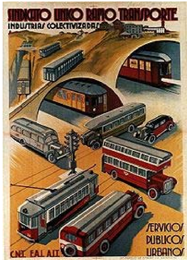
Poster que muestra la colectivización del transporte durante la Revolución social española de 1936

anarco-comunistas anti-sindicatos, quienes en Francia se agrupaban alrededor de la revista de Sébastien Faure Le Libertaire . Desde 1905 en adelante, los rusos que apoyaban esta posición comenzaron a apoyar el terrorismo económico y las expropiaciones ilegales.[11]