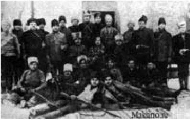
Integrantes del "Ejército Negro" ucraniano liderado por Néstor Makhno

derrotado posteriormente por los bolcheviques, quienes querían que los campesinos anarquistas ucranianos se sometieran a las órdenes del Partido Bolchevique.