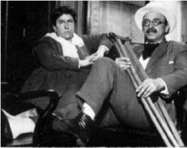
Alexander Berkman y Emma Goldman

ría determinado por los individuos dentro de los grupos envueltos, en lugar de capitalistas propietarios, inversionistas, bancos u otras presiones de un mercado.