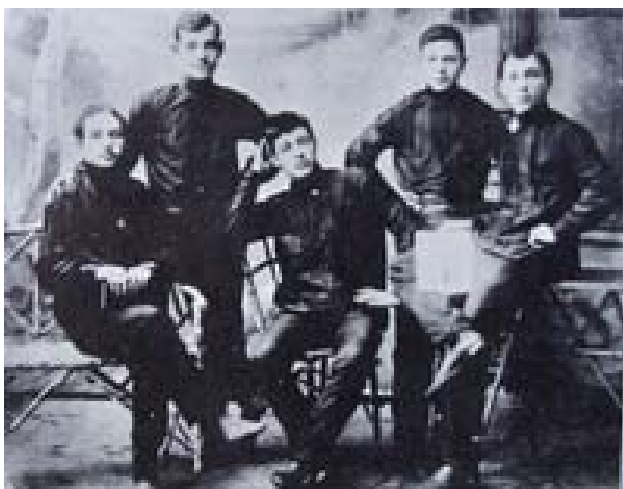
Fotografía de una reunión de Chernoe Znamia en Minsk en 1906

mentar su proyecto de cooperativas agrícolas organizadas bajo los principios del comunismo anarquista y fue derrotada militarmente.[11]