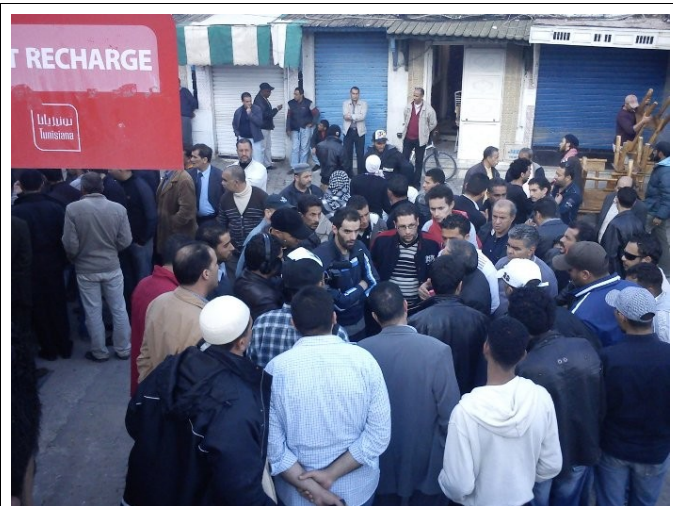
Manifestacio je la 1a de aprilo

Poste la homoj alvenas al la avenuo Habib Burguiba kaj denove manifestacias antaŭ la Nacia Teatro. Oni diskutas, oni debatas. Juna studentino alparolas nin kun sento esti ĉefrolulo de tio okazanta. Ŝi repuŝas la senĉesan sinintrudon de la okcidento en sia lando, nian superecosenton, ŝi parolas pri iu Tunizio tolerema, kapabla kunvivi, konstrui malsimilan kaj pli realan demokration ol tiu nia. Ni vidas en ŝi konvinkemon, memfidon. Ŝi estas la bildo pri popolo, kiu ekorganiziĝas, kiu havas esperon kaj