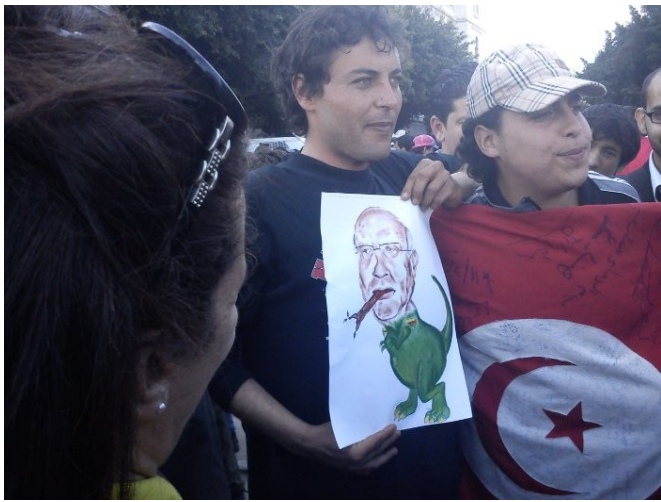
La popolo sin esprimas libere