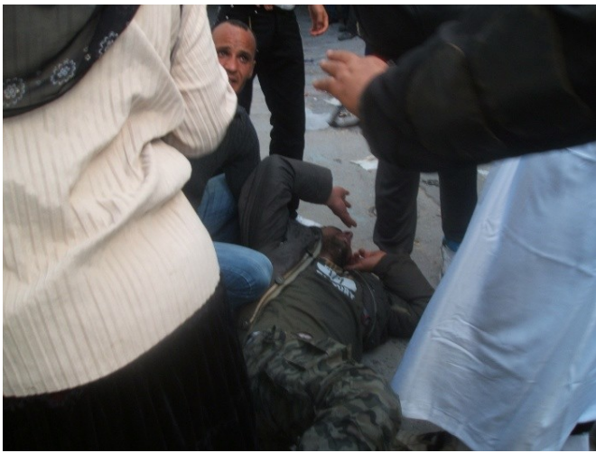
Vundito zorgita de la manifestaciantoj

nouchi. Ili faligis jam du registarojn post la falo de la diktatoro. La tunizia popolo plian fojon faris paŝon antaŭen, ĝi disigis la apogon de la Eŭropa Unio kaj Usono al la Ghanouchia registaro. Oni senoficigis la ĉefajn poliestrojn de la Ben Alia tempo, oni liberigis la politikajn prizonulojn, la RCD estas disigita, sed la strato deziras plu. La kontraŭrevolucio ankoraŭ vivas.